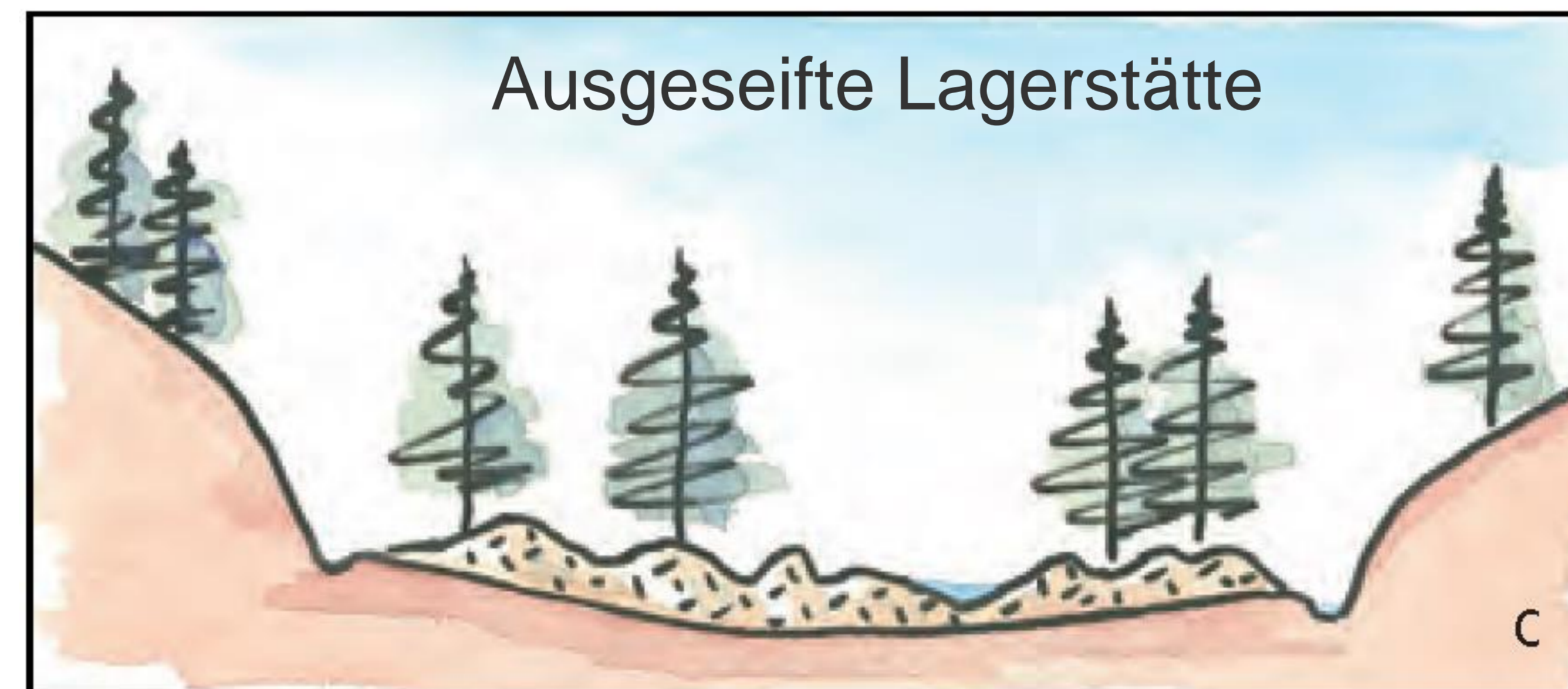
Schematischer Querschnitt durch ein Tal mit fluviatiler Zinnseife (aus HELM & KINNE 2014)