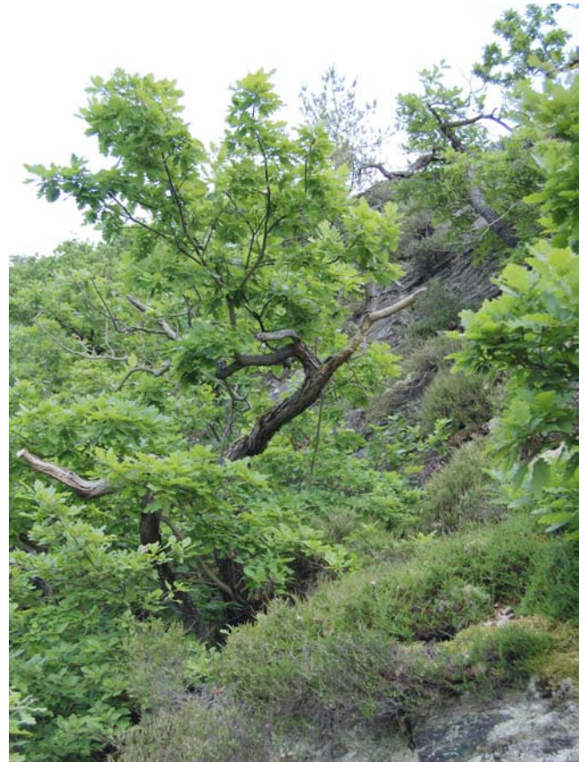
Abb. 2: Die beiden Aufnahmen zeigen am Beispiel der Eiche, in welchem Spektrum die Bäume auf den Wasserhaushalt reagieren (links: mittlerer Standort auf der Westlichen Hunsrückhochfläche (kolline Stufe, RLP sehr frisch) in ebener Lage; rechts: Sonnenhang am Rhein (Rheinsteig), Oberes Mittelrheintal, RLP äußerst trocken). Das Ausgangsgestein ist auf beiden Standorten Schiefer.

Fig. 2: Using the example of oak, the two pictures show the spectrum of the species's reaction to differences in the water supply (on the left: a typical site on the Western Hunsrück High Plain (colline stage, RLP water regime class 'very fresh') in flat situation; to the right: sunny slope in the Rhine (Rheinsteig), Upper Central Rhine Valley (RLP water regime class 'extremely dry'). The parent rock is slate at both sites.